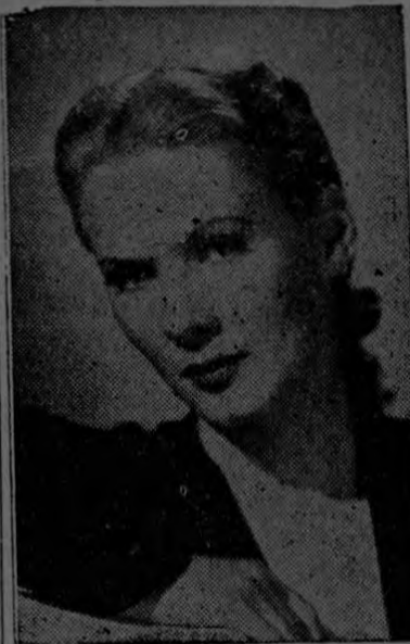
El maquillaje y arreglo personal de JUNE VINCENT, adorable estrella de Universal International, están siempre de acuerdo con la ocasión y circunstancias, como afirma el famoso experto de Hollywood, Max Factor Jr.

El maquillaje para los deportes debe ser sencillo y natural, nada sofisticado y no presentar ni la menor complicación. Sin embargo, su aplicación debe hacerse con el mismo cuidado e idéntica meticulosidad que la del que use usted